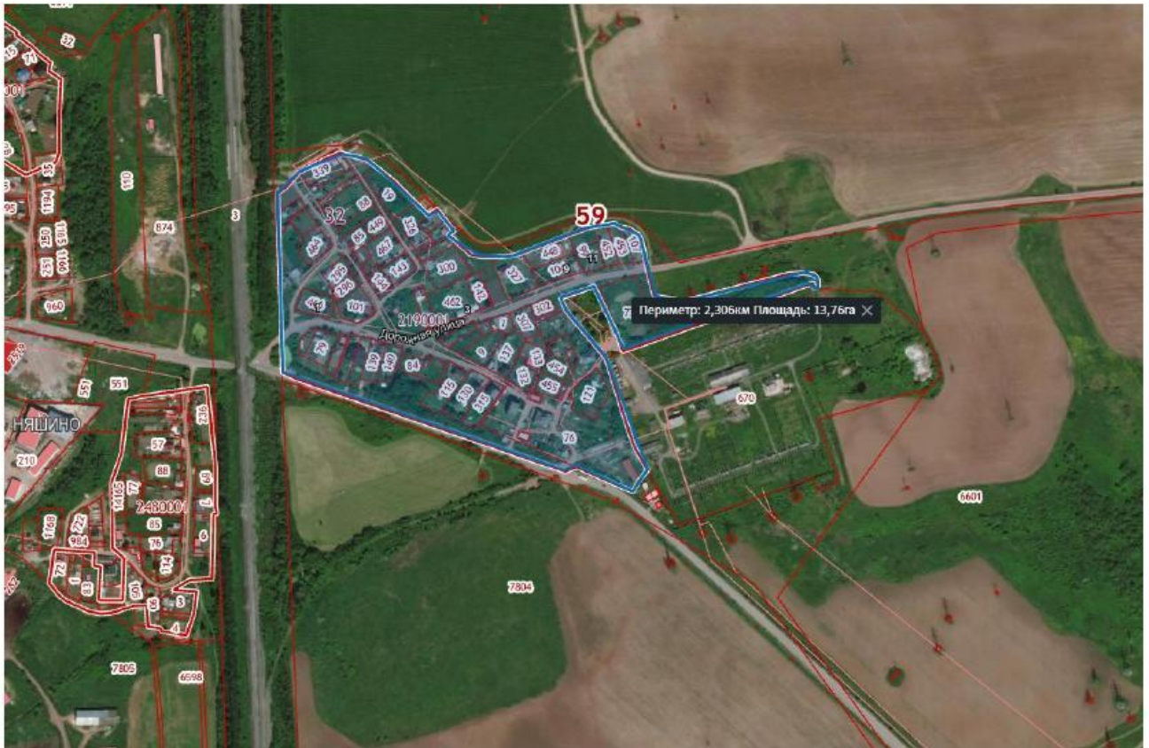
Схема для разработки проекта межевания территории кадастрового квартала 59:32:2190001 д. Няшино Фроловского сельского поселения Пермского муниципального района Пермского края